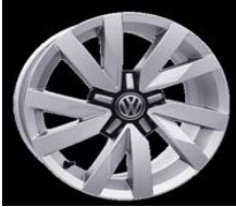
Легкосплавные диски «Atagon» 6,5 J x 16, опционально для Trendline (PJ1)