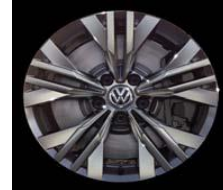
Легкосплавные диски «Ancona» 8 J x 17, стандартно для Alltrack