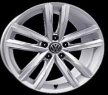
Легкосплавные диски «Dartford» 8 J x 18, серебристые, опционально для Highline (PJ7)