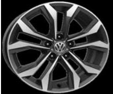
Легкосплавные диски «Soho» 7 J x 17, опционально для Comfortline и Highline (PJ5)