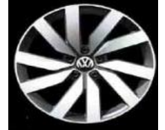
Легкосплавные диски «Marseille» Volkswagen R, 8 J x 18, опционально для Comfortline и Highline (PJ6)