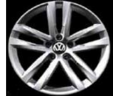
Легкосплавные диски «Salvador» Volkswagen R, 7 J x 17, опционально для Comfortline и Highline (PJ9)