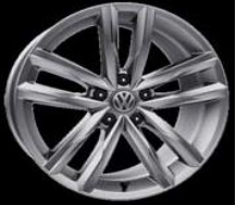
Легкосплавные диски «Dartford» 8 J x 18, серый металл, опционально для Highline (PJ6)