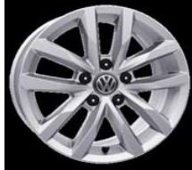
Легкосплавные диски «Sepang» 6,5 J x 16, стандартно для Comfortline