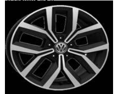
Легкосплавные диски «Nivelles» 7 J x 17, опционально для Comfortline и Highline (PJ4)