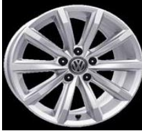
Легкосплавные диски «London» 7 J x 17, стандартно для Highline