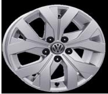
Легкосплавные диски «Moscow» 6,5 J x 16, стандартно для Trendline