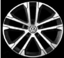
Легкосплавные диски «Singapore» Volkswagen R, 7 J x 17, опционально для Comfortline и Highline (PJ8)