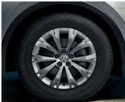
Montana 7J x 17