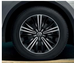
Nizza 7J x 18