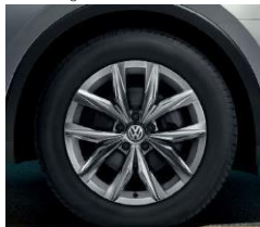
Kingston 7J x 18