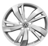
Легкосплавные колеса "Las Minas" 6J x 16 Опционально для Status и Exclusive