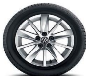
Легкосплавные колеса "Akono" 6J x 15 Стандартно для Exclusive, опционально для Status